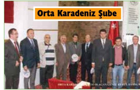
Orta Karadeniz Şube