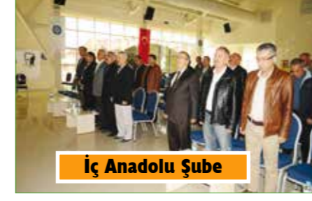
İç Anadolu Şube