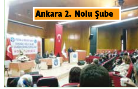
Ankara 2. Nolu Şube