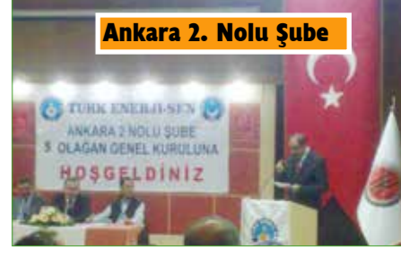
Ankara 2. Nolu Şube