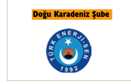
Doğu Karadeniz Şube