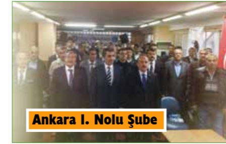
Ankara 1. Nolu Şube

Türk Enerji-Sen teşkilatı için hayırlı olsun