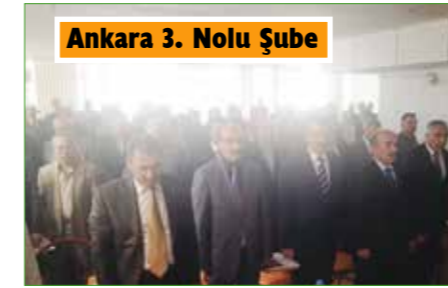
Ankara 3. Nolu Şube