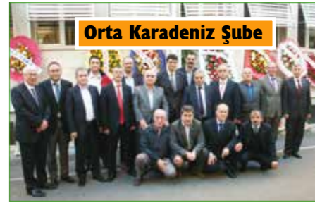
Orta Karadeniz Şube