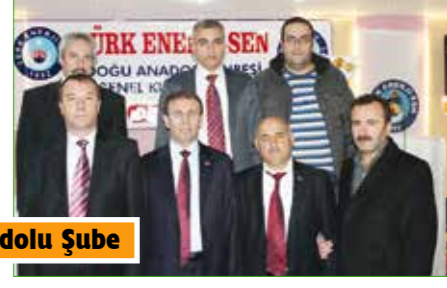
Doğu Anadolu Şube