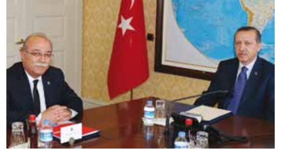
Koncuk: "Enflasyon farkı bütçeye eklenmelidir"