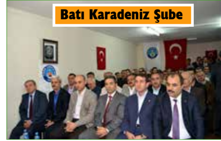
Batı Karadeniz Şube