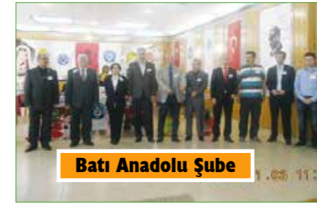
Batı Anadolu Şube