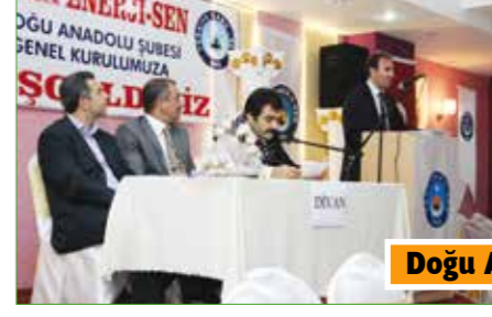
Doğu Anadolu Şube